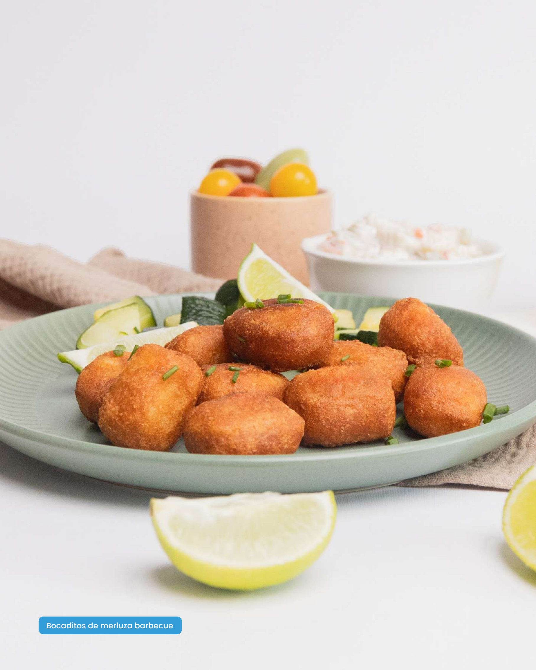
Bocaditos de merluza barbecue